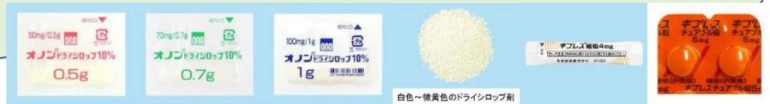
白色～淡黄色のドライシロップ剤