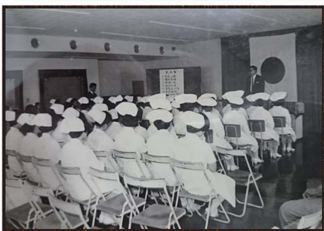
第1期生 戴帽式 昭和41年10月11日

名鉄のイニシャルの「M」のモチーフと看護学生の希望の芽を大切に育てる意味を表現しました。